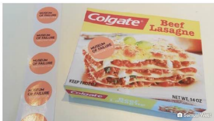
1. Beef Lasagne von Colgate